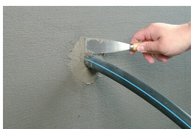
Enduction au ciment instantané