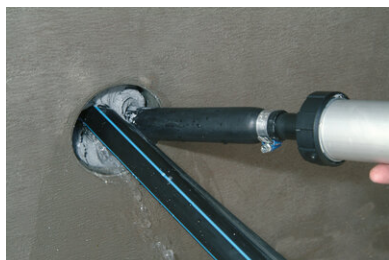
Remplissage de l'espace annulaire