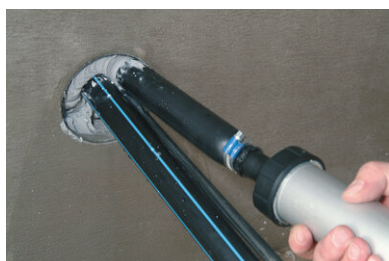
Plus d'entrée d'eau